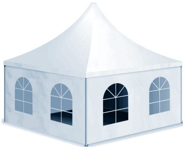
Главный профиль 140 x 100 x 3 мм